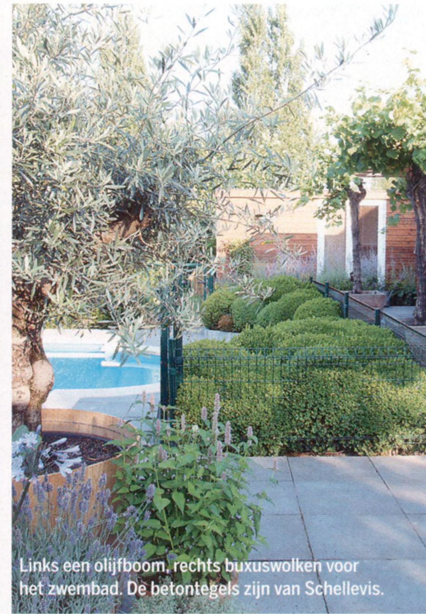
Links een olijfboom, rechts buxuswolven voor het zwembad. De betontegels zijn van Schellevis.