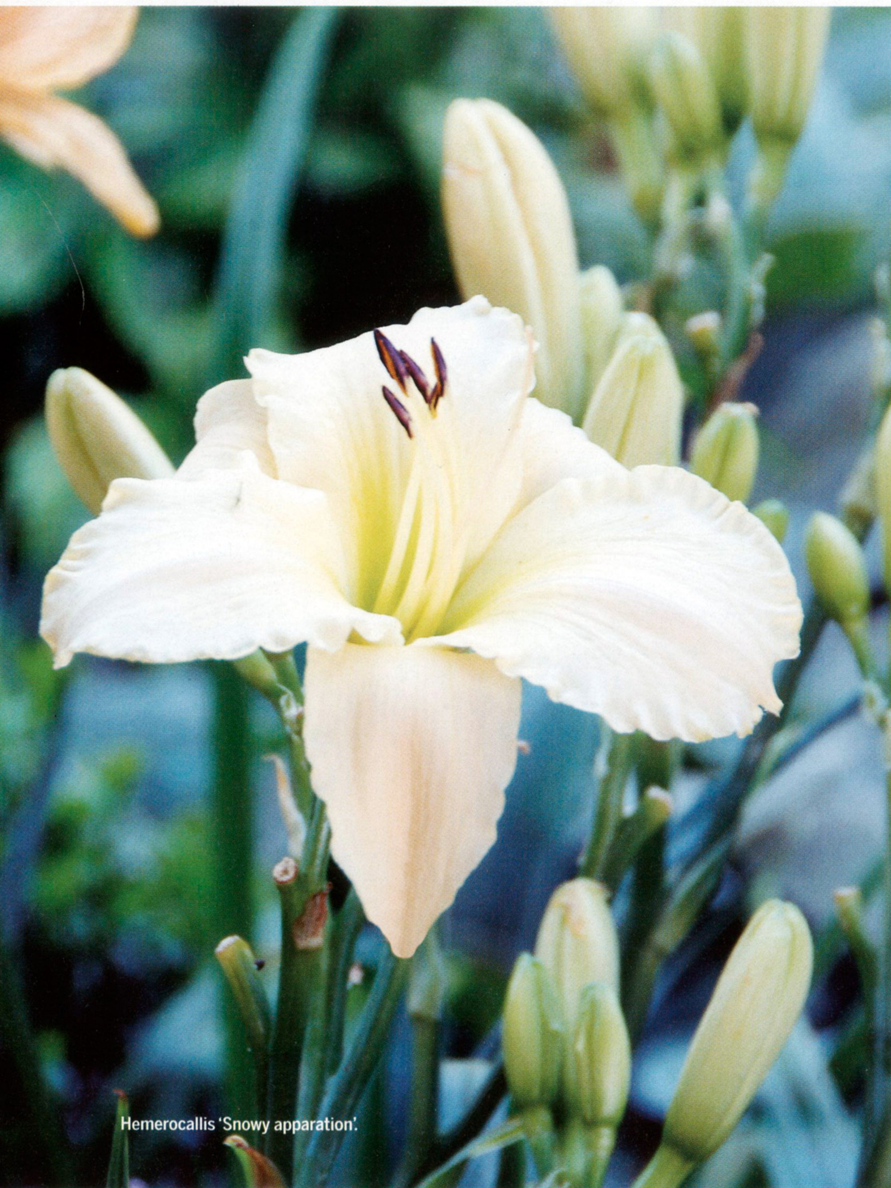
Hemerocallis 'Snowy apparition'.