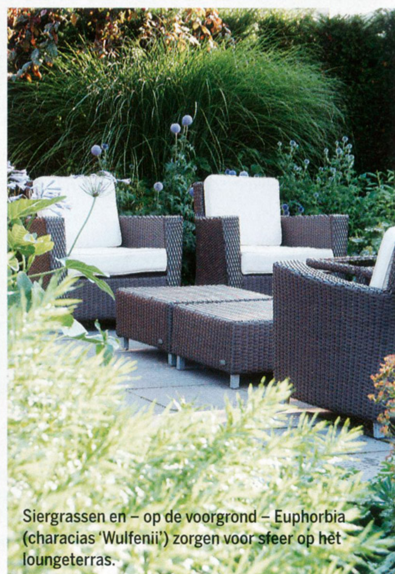
Siergrassen en – op de voorgrond – Euphorbia (characias 'Wulfenii') zorgen voor sfeer op het loungeterras.