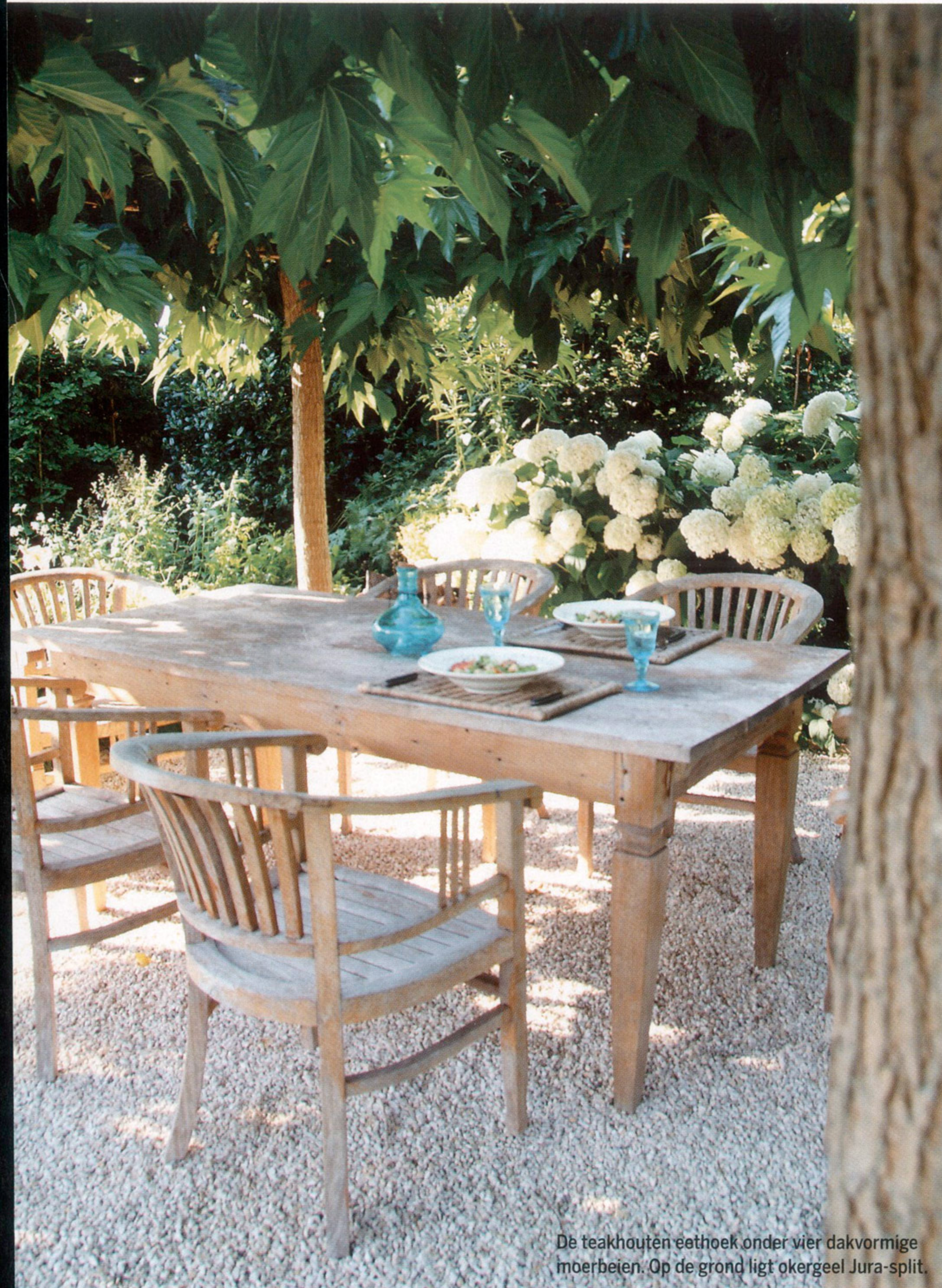
De teakhouten eethoek onder vier dakvormige moerbeien. Op de grond ligt okergeel Jura-split.