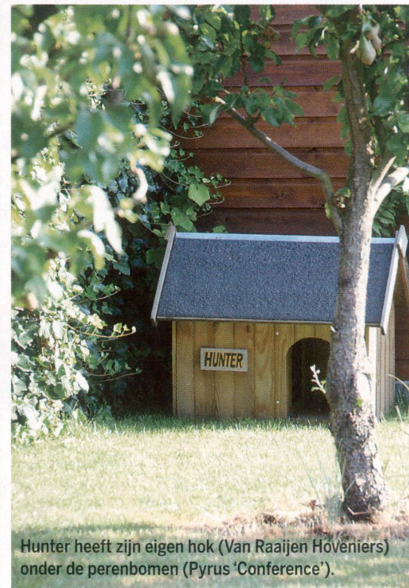
Hunter heeft zijn eigen hok (Van Raaijen Hoveniers) onder de perenbomen (Pyrus 'Conference').