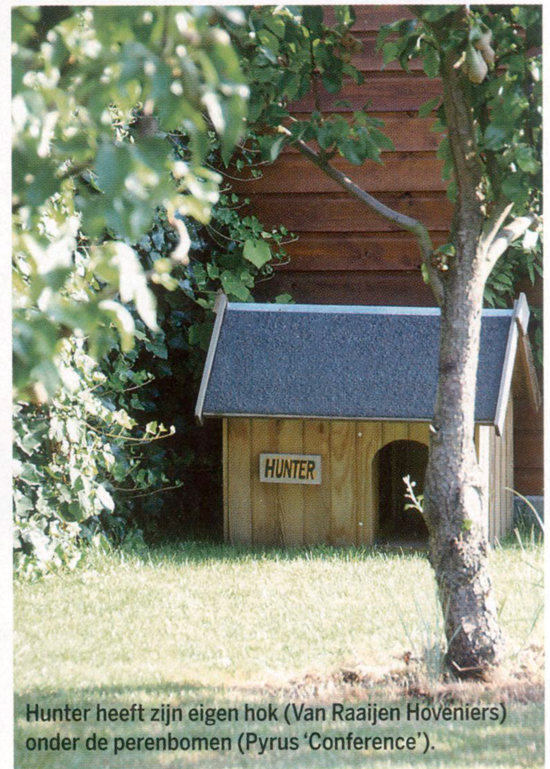
Hunter heeft zijn eigen hok (Van Raaijen Hoveniers) onder de perenbomen (Pyrus 'Conference').