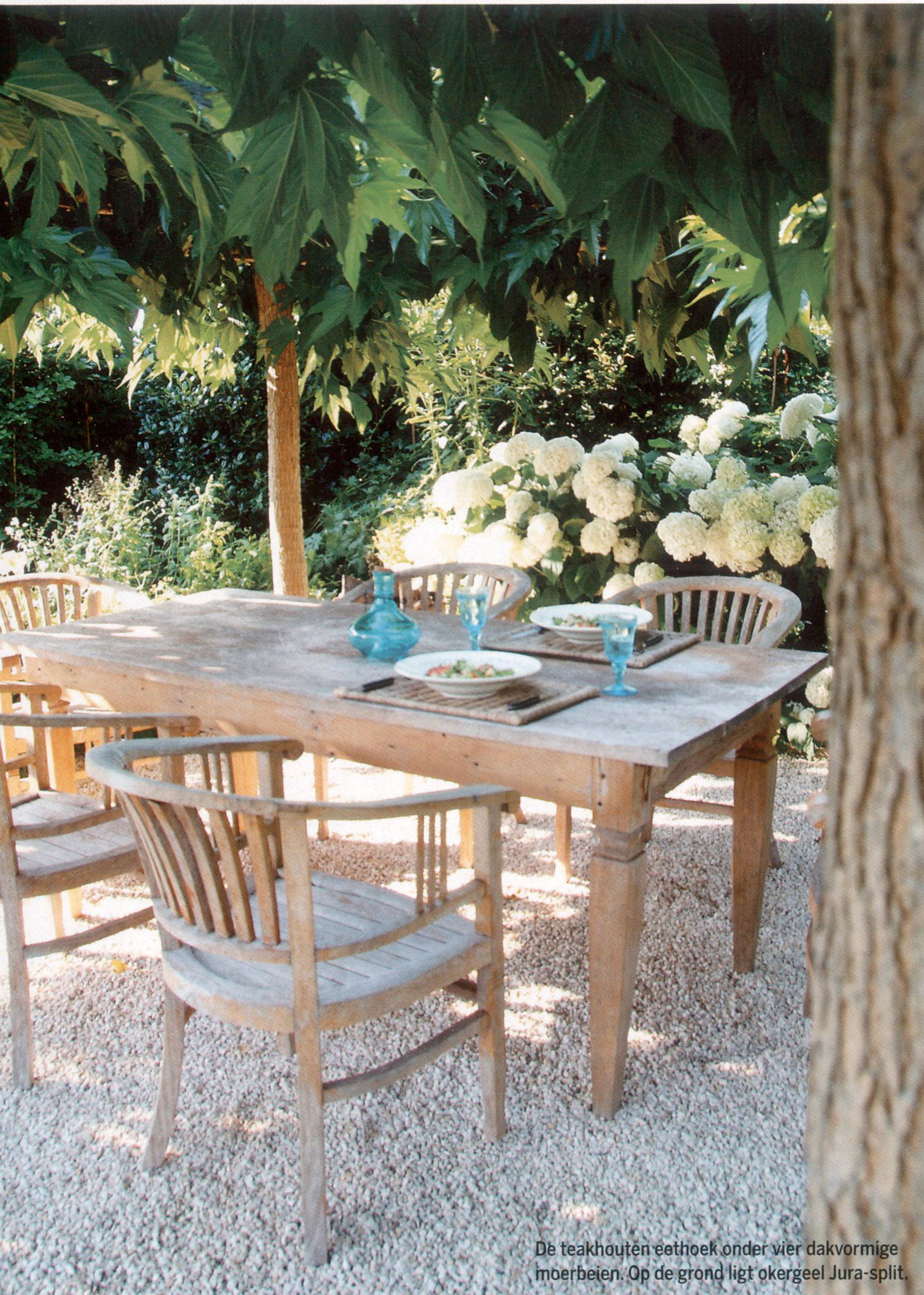
De teakhouten eethoek onder vier dakvormige moerbeien. Op de grond ligt okergeel Jura-split.