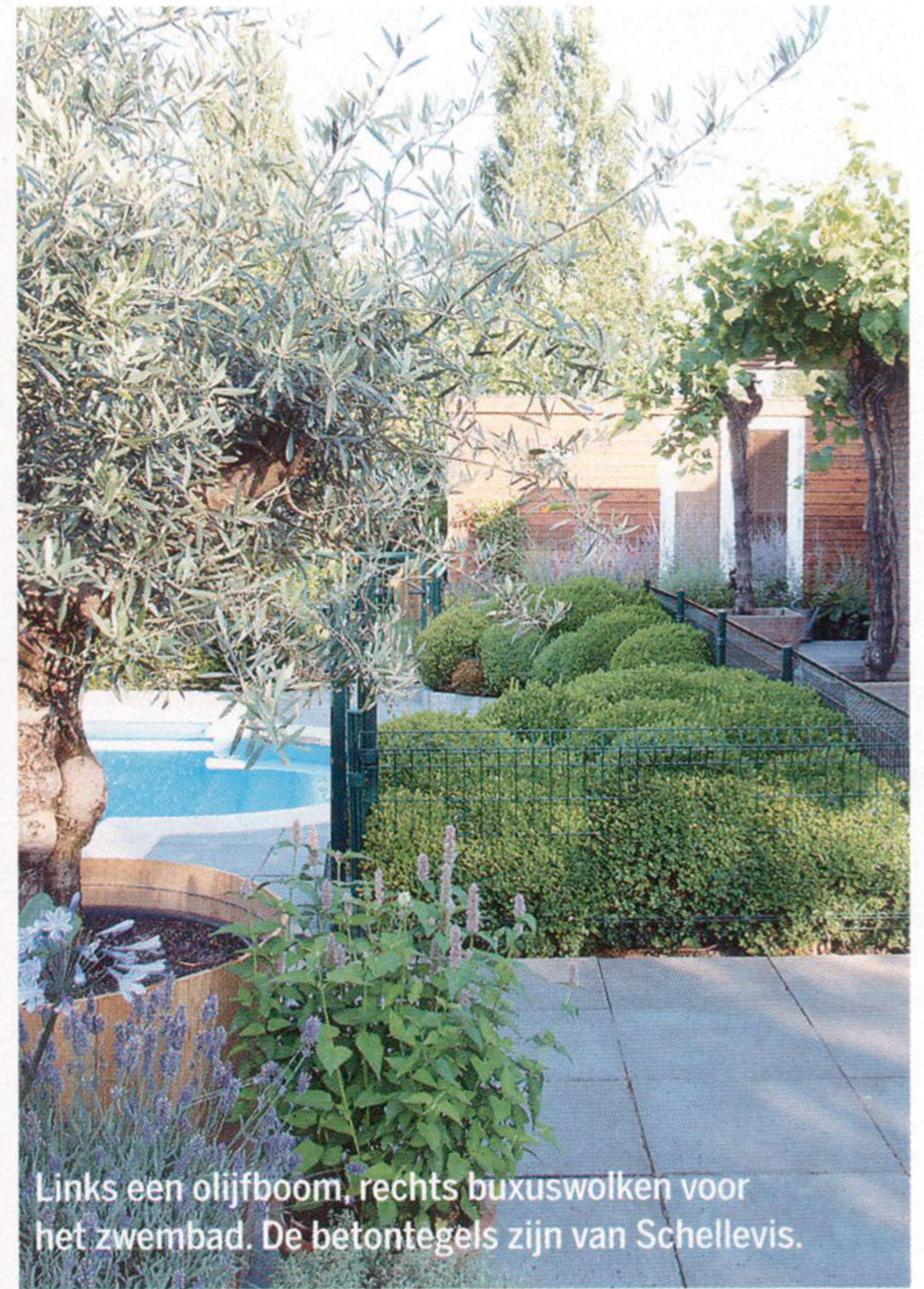
Links een olijfboom, rechts buxuswolven voor het zwembad. De betontegels zijn van Schellevis.