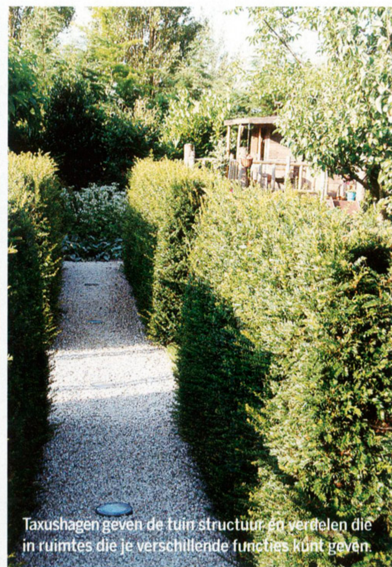
Taxushagen geven de tuin structuur en verdelen die in ruimtes die je verschillende functies kunt geven.