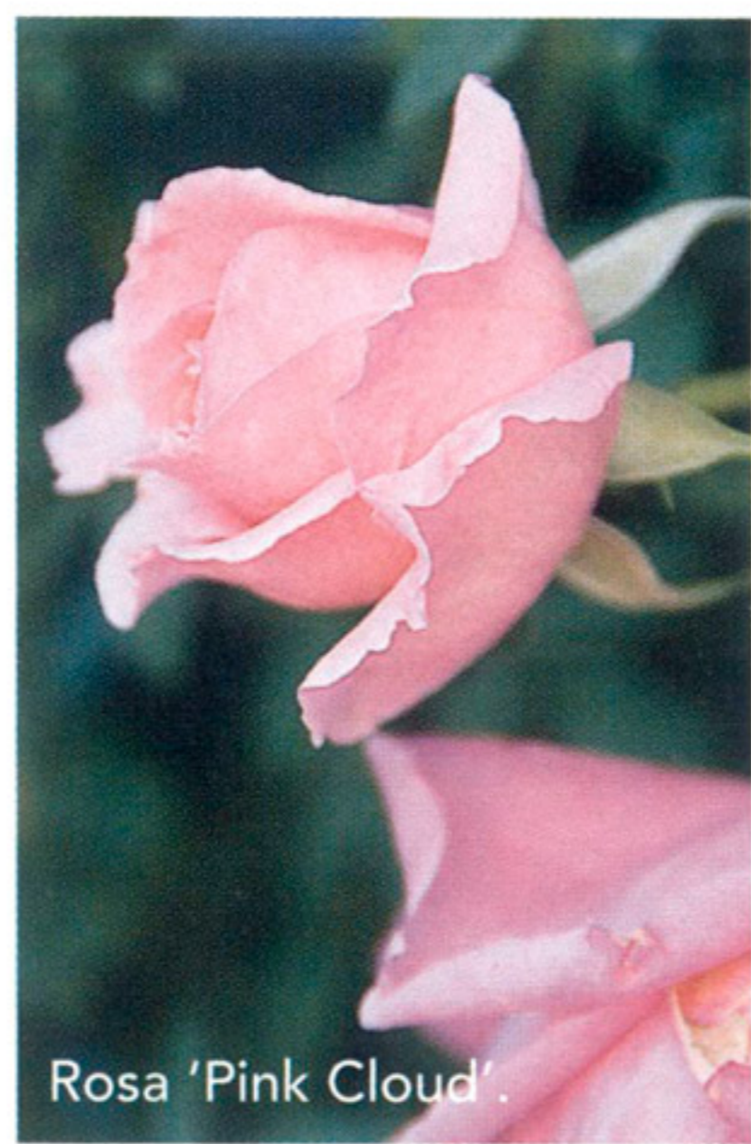
Rosa 'Pink Cloud'.