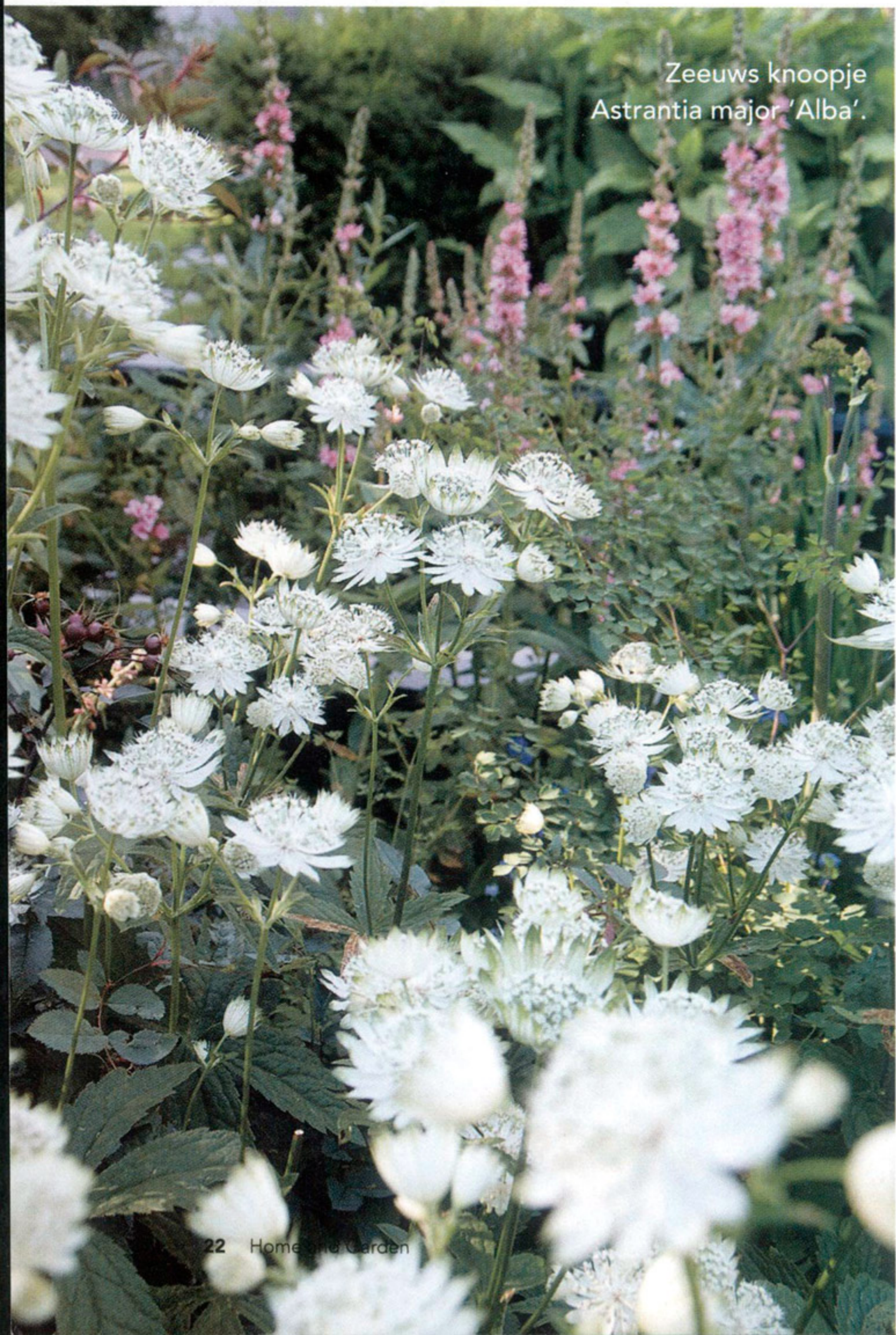
Zeeuws knoopje Astrantia major 'Alba'.