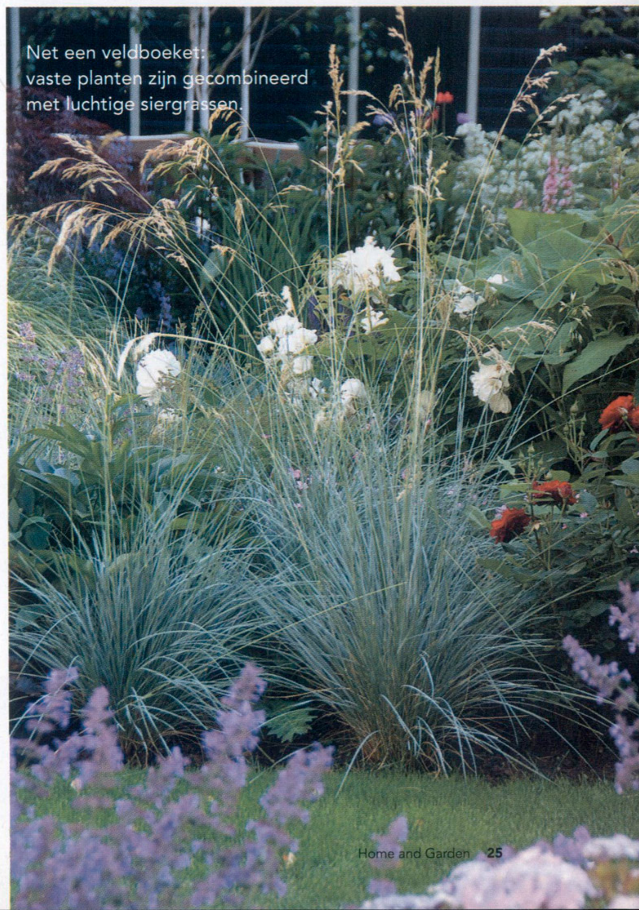
Net een veldboeket: vaste planten zijn gecombineerd met luchtige siergrassen.