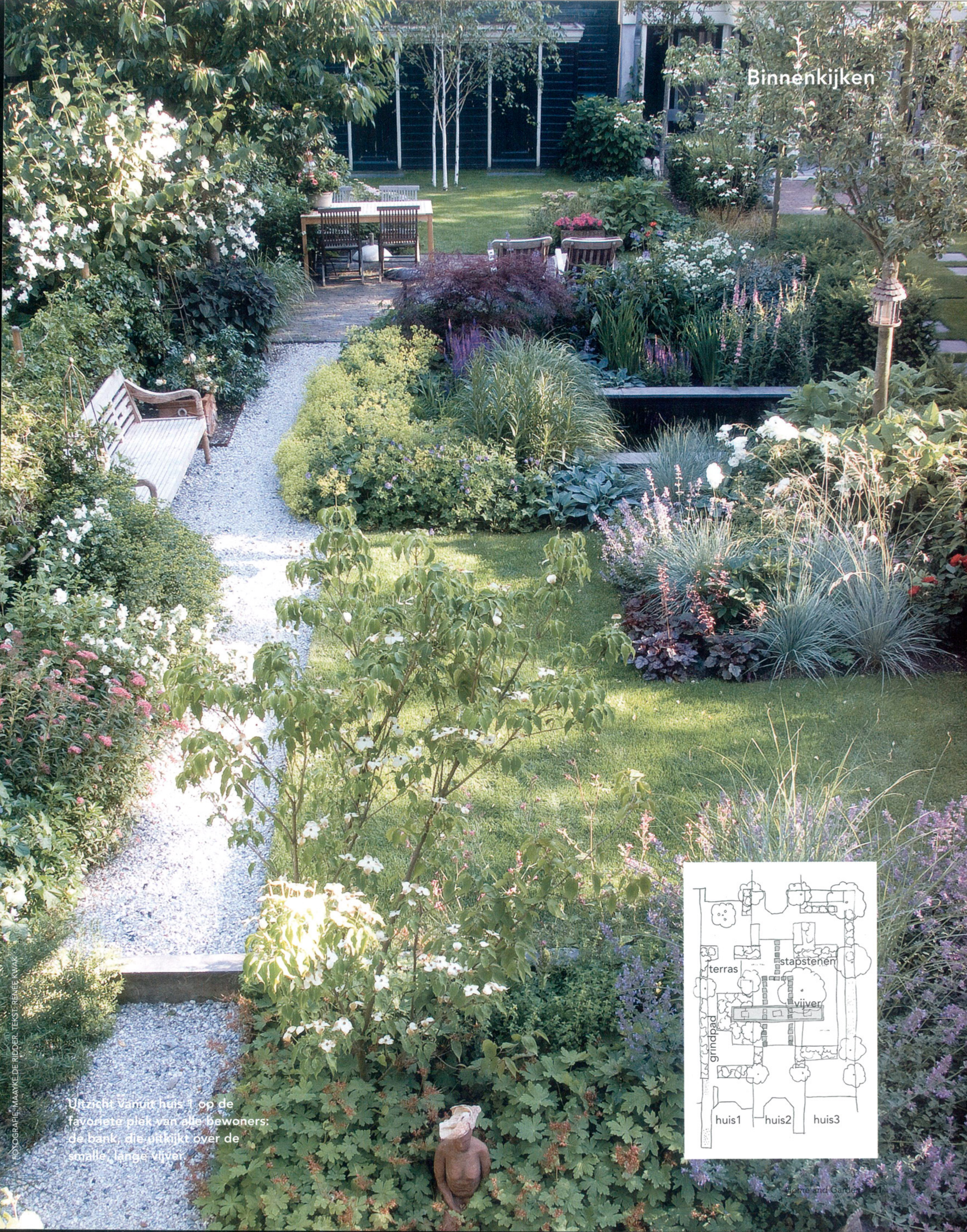
Uitzicht vanuit huis 1 op de favoriete plek van alle bewoners: de bank, die uitkijkt over de smalle, lange vijver.