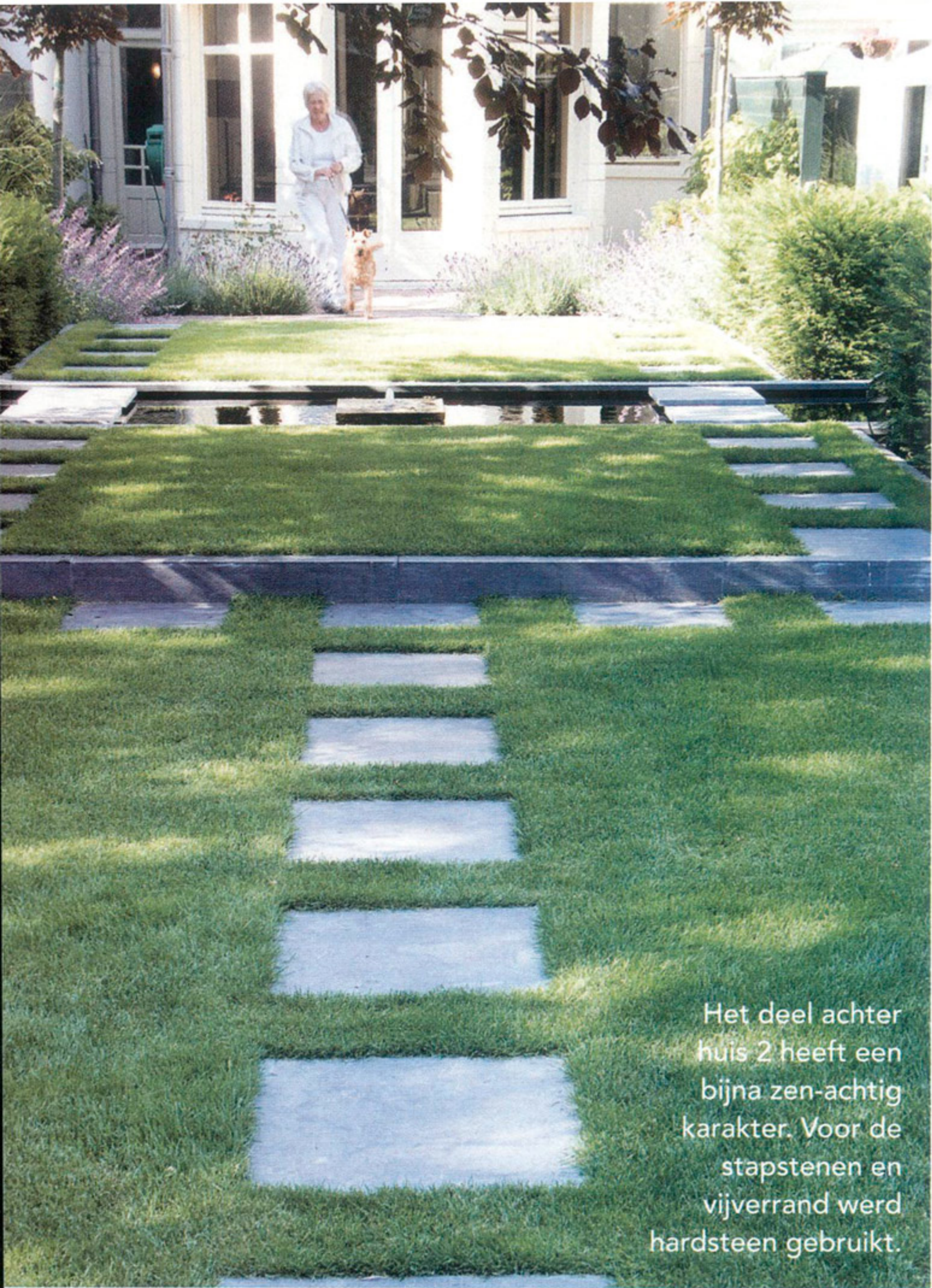
Het deel achter huis 2 heeft een bijna zen-achtig karakter. Voor de stapstenen en vijverrand werd hardsteen gebruikt.