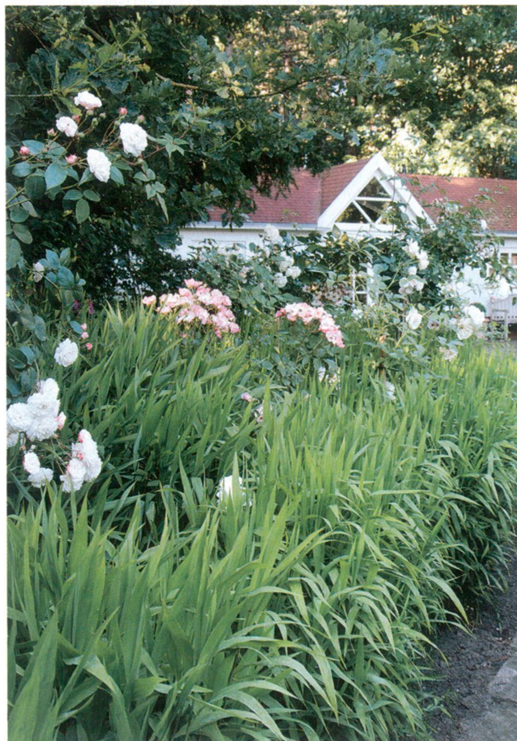
RECHTS | Rosa Iceberg met bamboe, op de achtergrond het gastenverblijf.