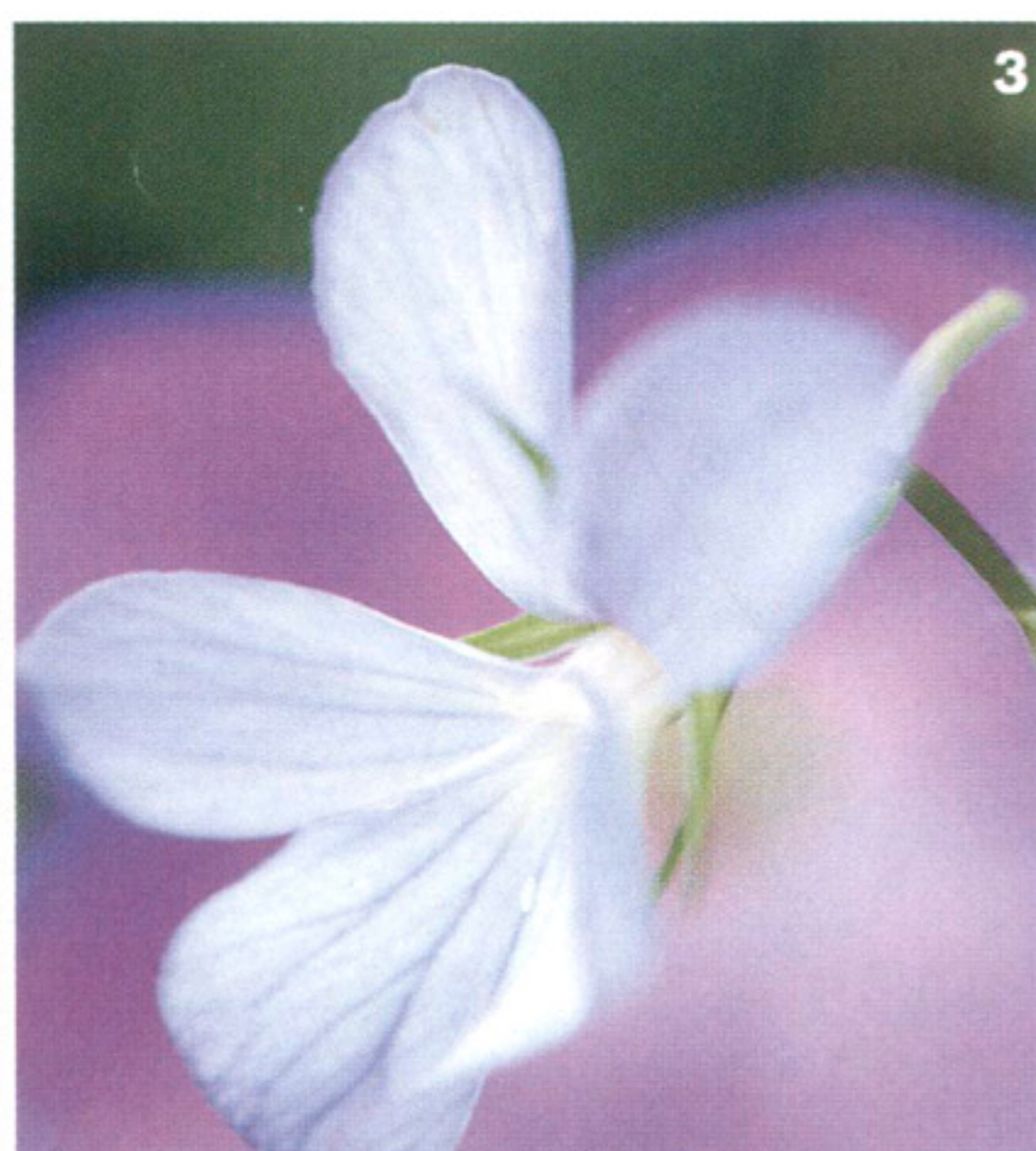
1 | Salvia verticillata 'Purple Rain'. 2 | Scabiosa caucasica 'Miss Willmott'. 3 | Viola cornuta .