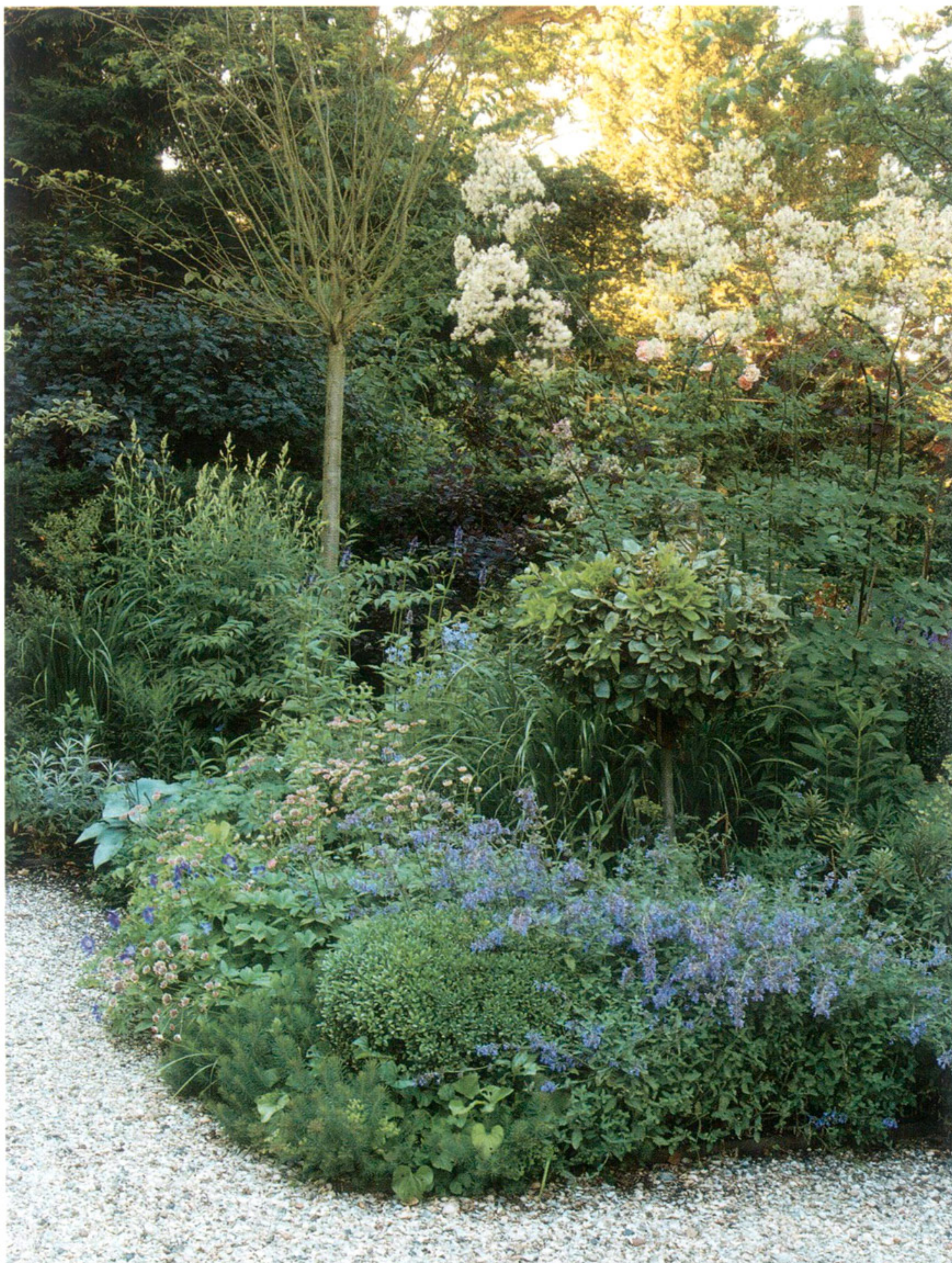
BOVEN | Blauw is een van de hoofdkleuren van de beplanting.