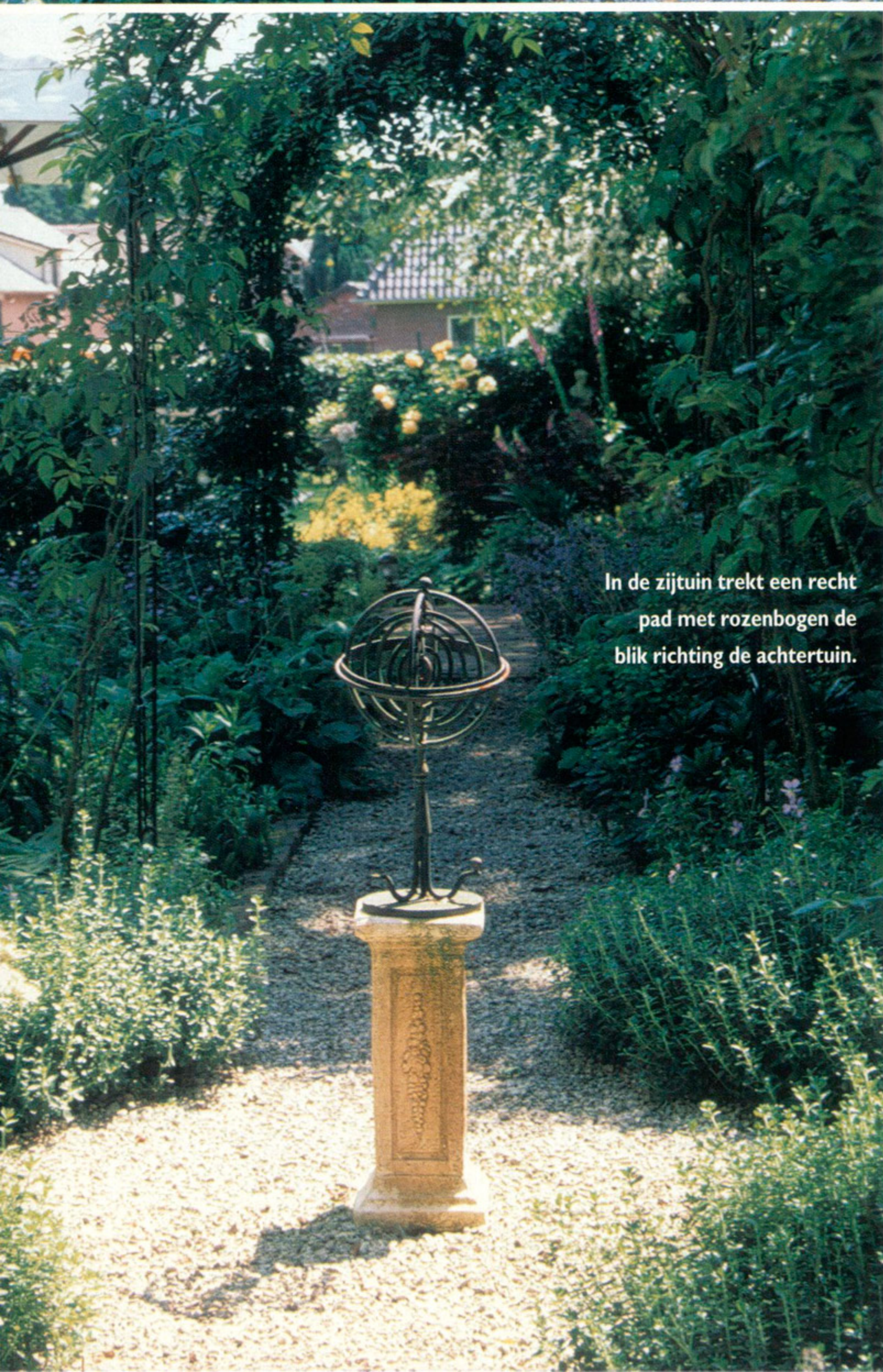
In de zijtuin trekt een recht pad met rozenbogen de blik richting de achtertuin.