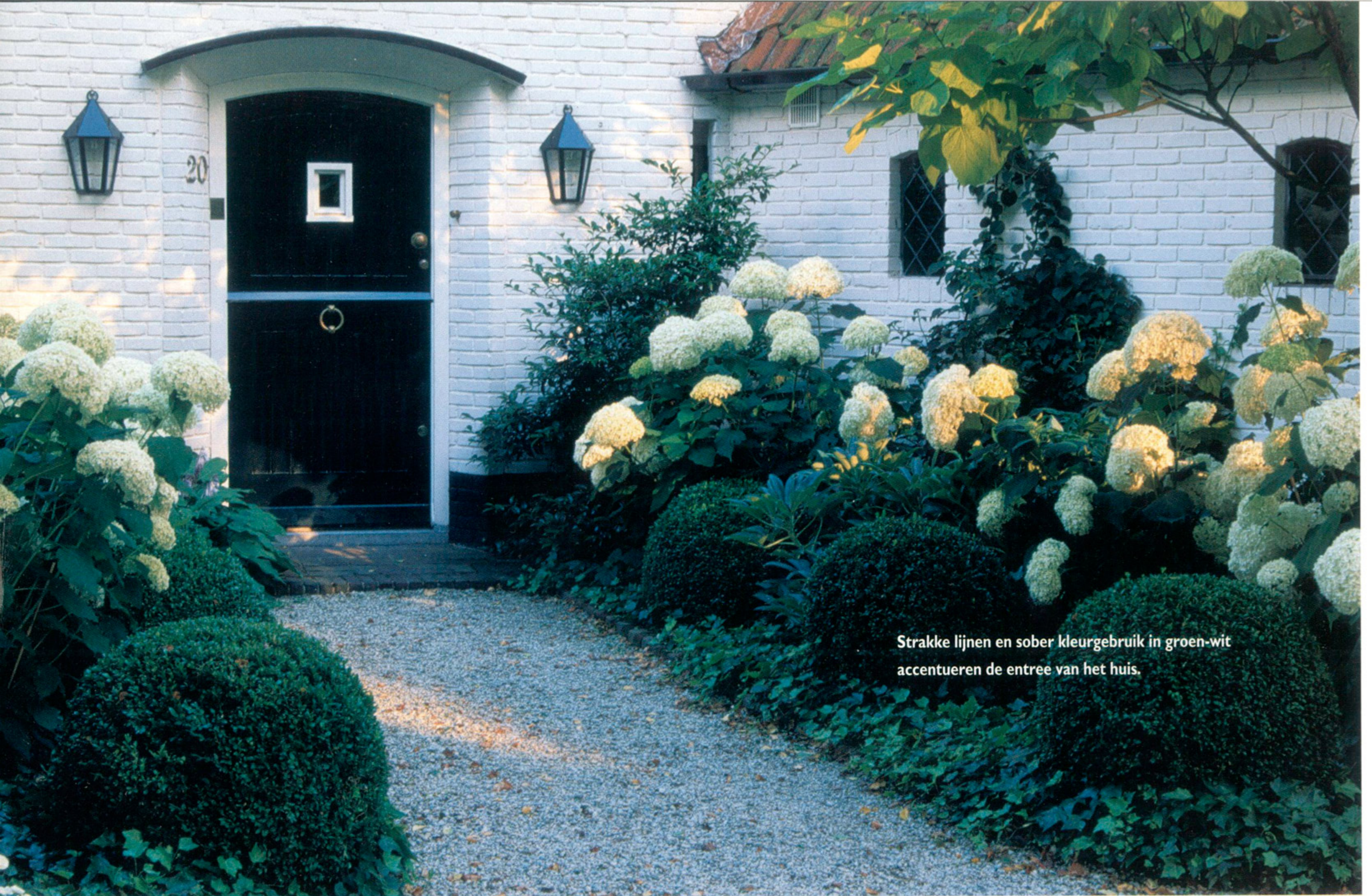
Strakke lijnen en sober kleurgebruik in groen-wit accentueren de entree van het huis.