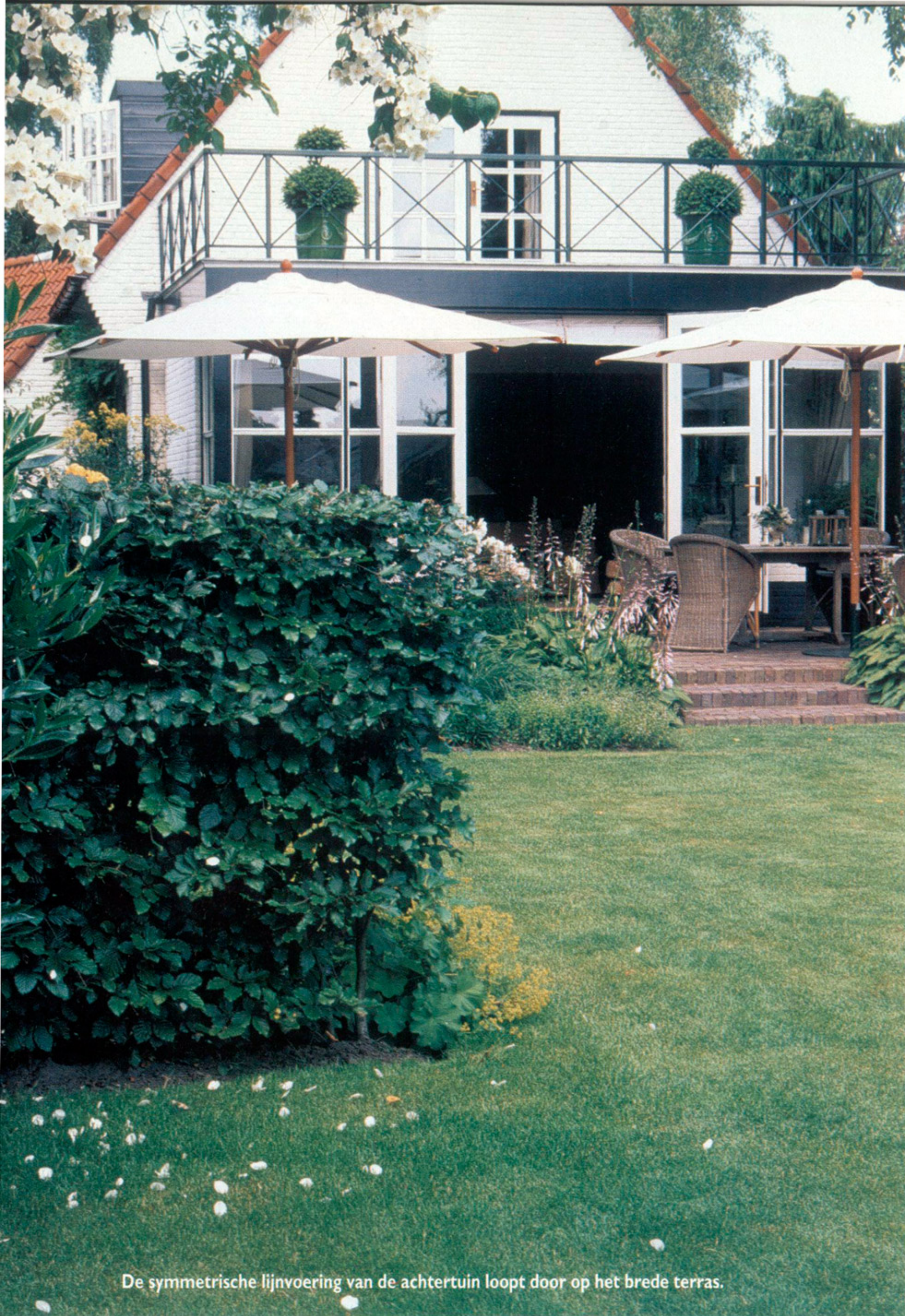
De symmetrische lijnvoering van de achtertuin loopt door op het brede terras.