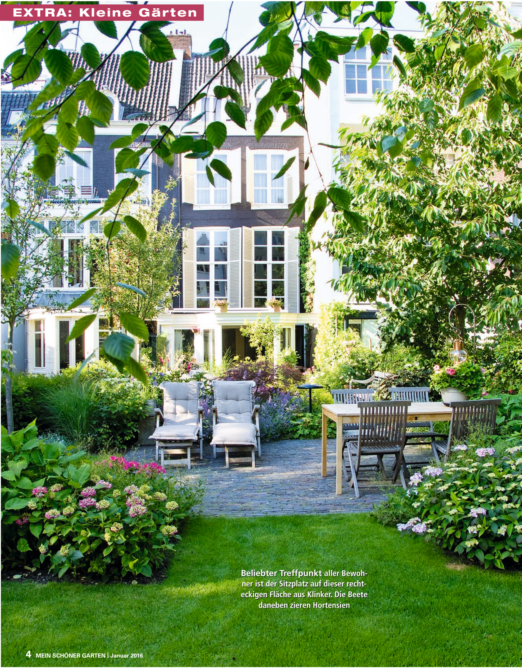
Beliebter Treffpunkt aller Bewohner ist der Sitzplatz auf dieser rechteckigen Fläche aus Klinker. Die Beete daneben zieren Hortensien